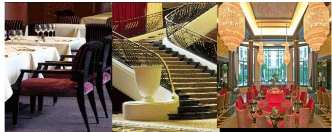
Hôtel Hilton Arc de Triomphe Polo & RH