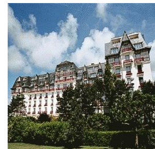
Hôtel Hermitage ***** La Baule – Rencontres d'automne