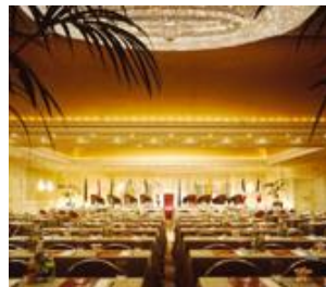
Le Sheraton Bruxelles UEDRH