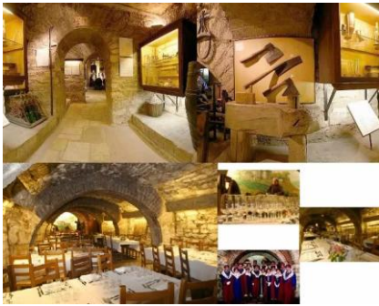
Le Musée du Vin à Paris Vin & RH