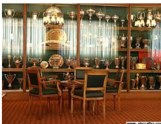
Le Racing Club de France Rugby & RH